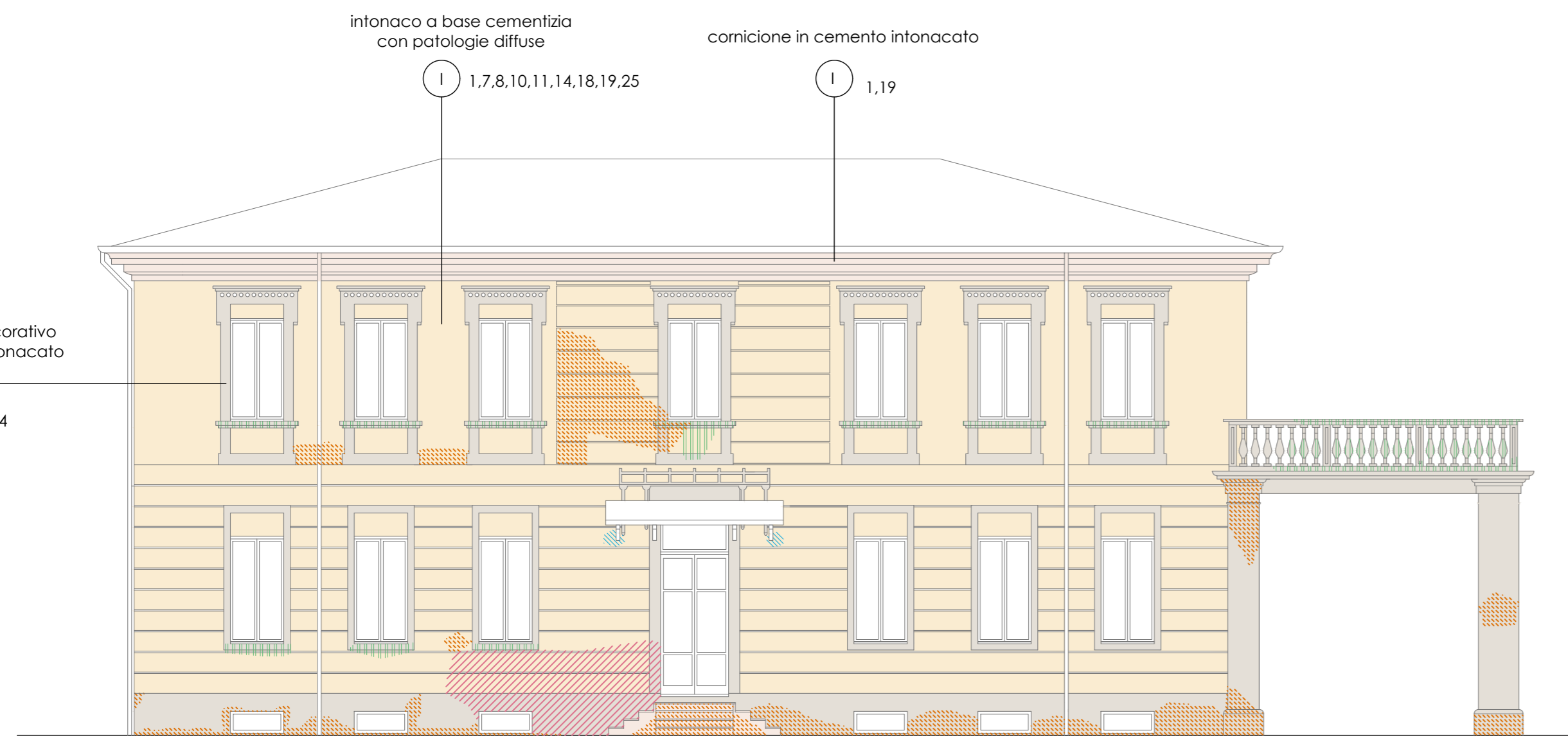
PROSPETTO FRONTE EST stato di fatto - scala 1:100