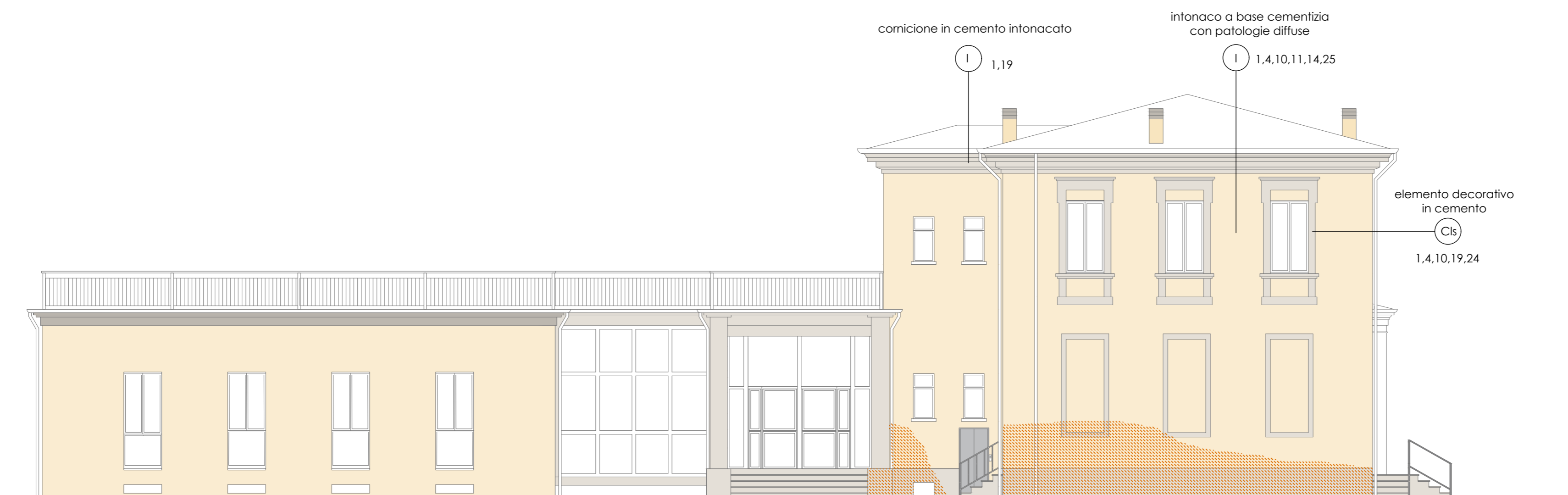
PROSPETTO FRONTE SUD stato di fatto - scala 1:100