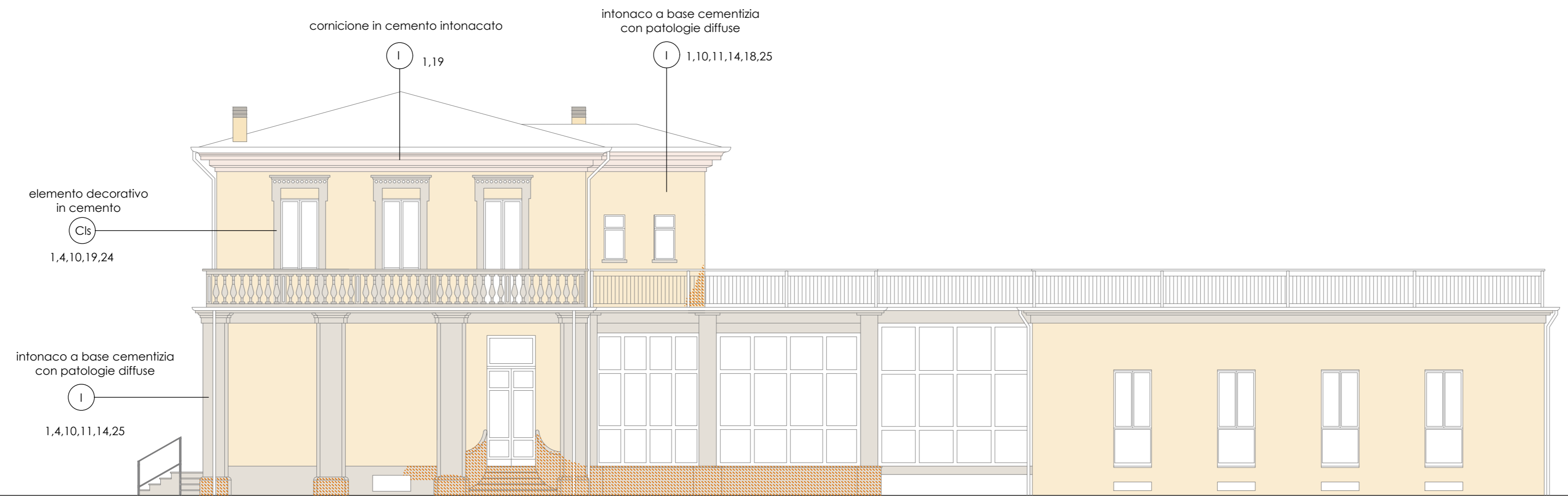
PROSPETTO FRONTE NORD stato di fatto - scala 1:100