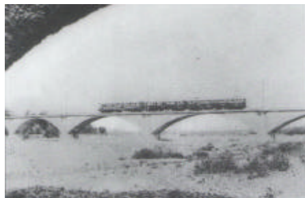
Il treno sul ponte del Nure a Ponte dell'Olio

per superare periodi di disoccupazione, convogliando inoltre mano d'opera verso la città di Piacenza. Dopo la seconda guerra mondiale nonostante i progressi tecnici (La linea Piacenza- Bettola nell'anno 1955 veniva percorsa in 1 ora ) cambio' il movimento di passeggeri e merci sostituito dal movimento su gomma. Il 1 Marzo 1967 arrivo' la cessazione ufficiale della ferrovia Piacenza-Bettola