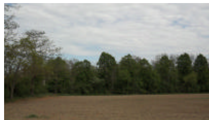
Immagine del Bosco di Fornace Vecchia

Nell'area nidificano numerose specie ornamentiche tipiche degli habitat fluviali con ampi greti ghiaiosi, quali Sterna comune, Corriere piccolo (Charadrius dubius), Occhione (Burhinus oedicephalus) e quelle di praterie aride, quali Calandro (Anthus campestris), Calandrella (Calandrella brachydactyla) e Starna (Perdix perdix). In